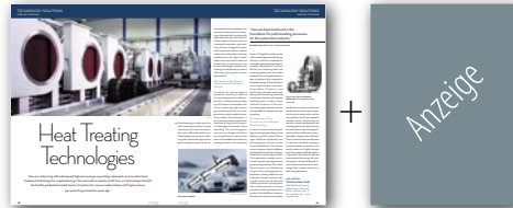
Doppelseite PR-Profil + Anzeige (210 x 280 mm)